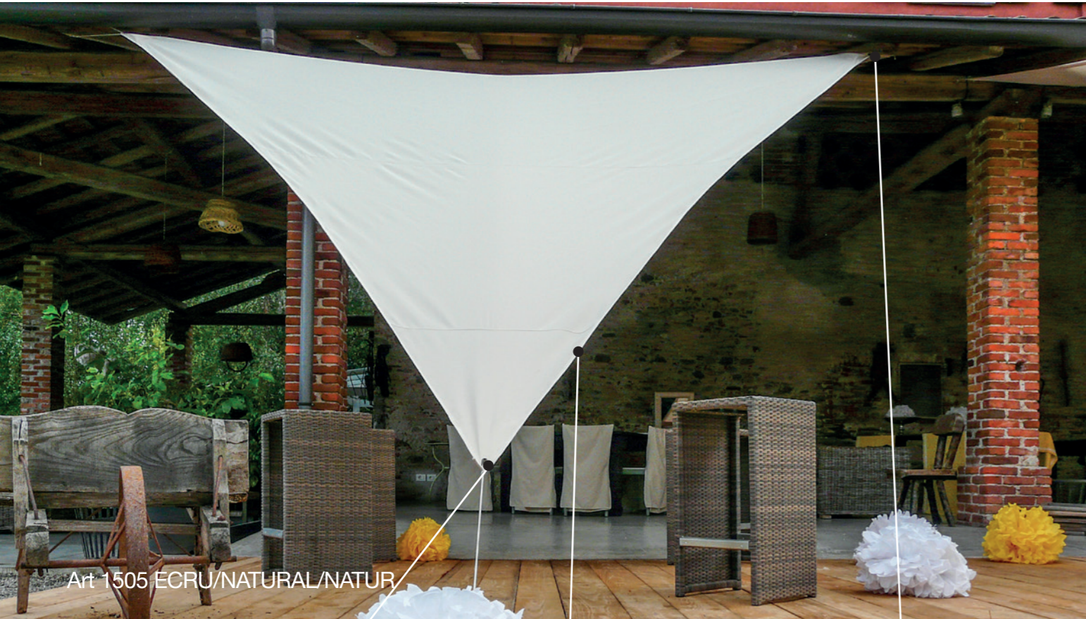
Art 1505 ECRU/NATURAL/NATUR