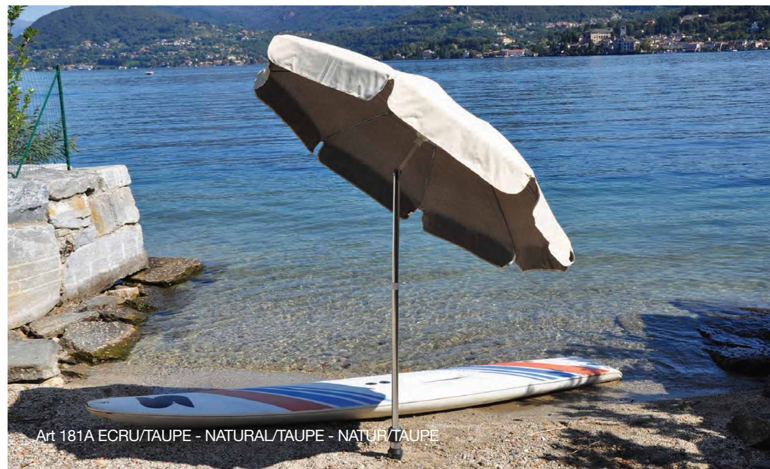
Art 181A ECRU/TAUPE - NATURAL/TAUPE - NATUR/TAUPE