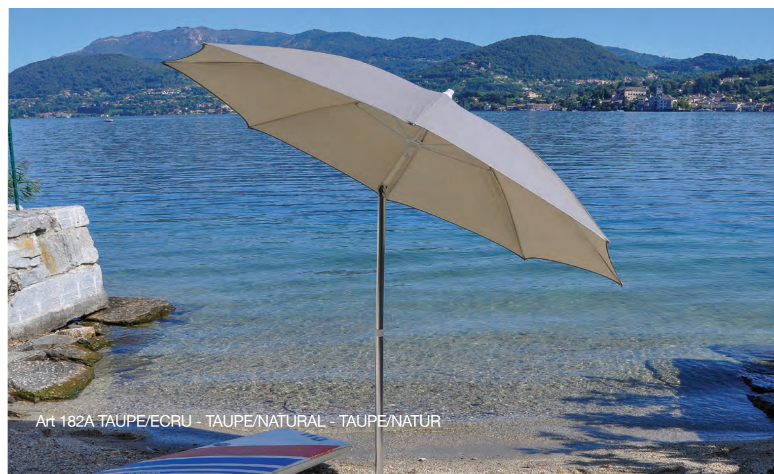
Art 182A TAUPE/ECRU - TAUPE/NATURAL - TAUPE/NATUR