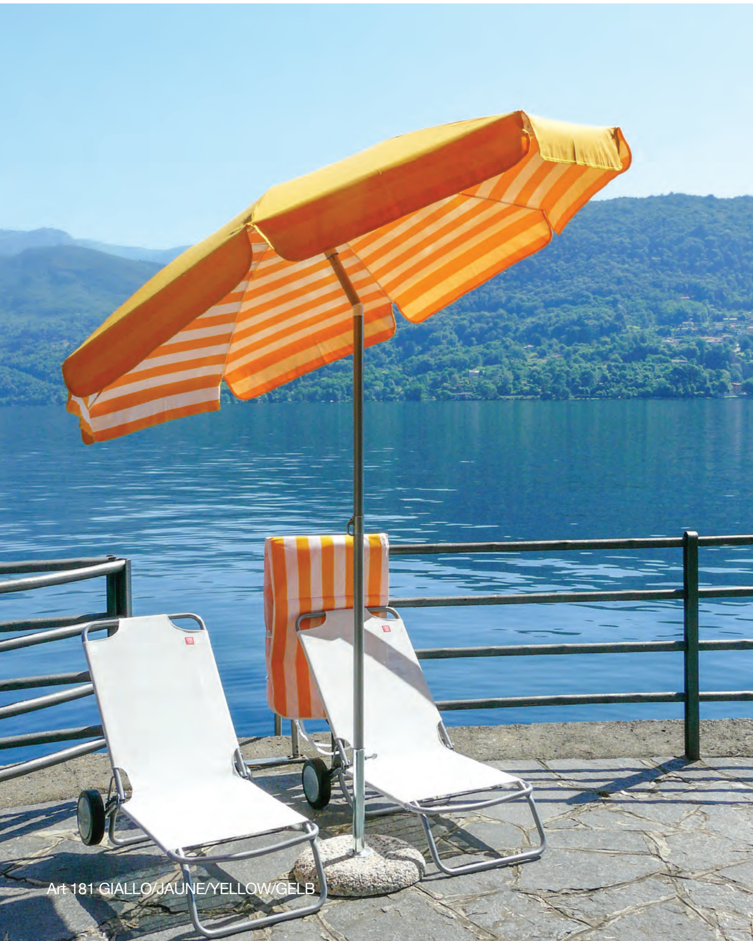
Art 181 GIALLO/JAUNE/YELLOW/GELB