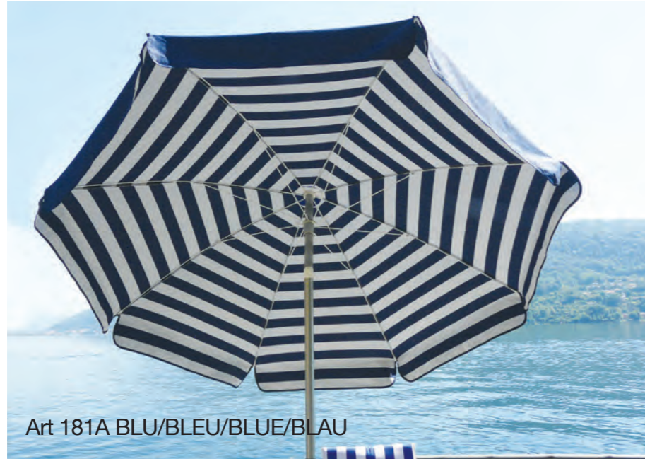
Art 181A BLU/BLEU/BLUE/BLAU

Ombrellone adatto all'uso privato e professionale leggero, con tessuto cotone duplex, disponibile con telaio palo acciaio o palo alluminio.