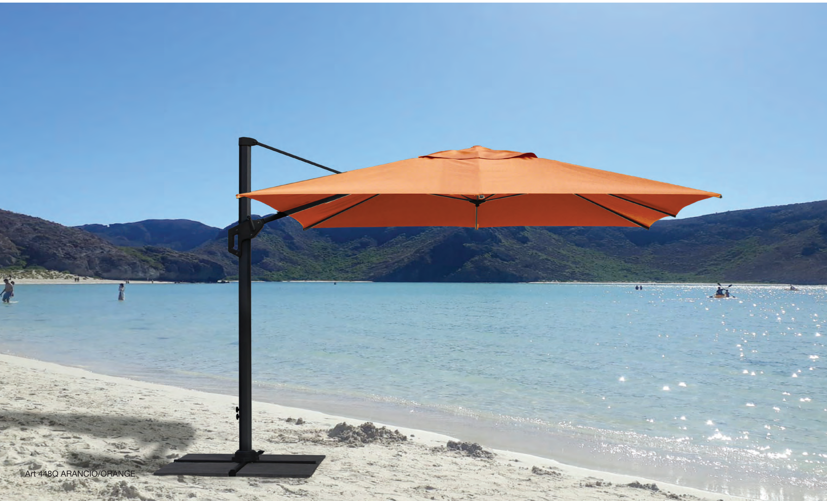
Art 448Q ARANCIO/ORANGE